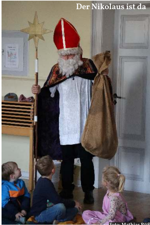
Der Nikolaus ist da

te er ein kleines Geschenk in seinem Sack. Nachdem die Kinder ihm ein Lied vorgesungen haben, verschwand der Bischof Nikolaus genau so geheimnisvoll, wie er gekommen war.