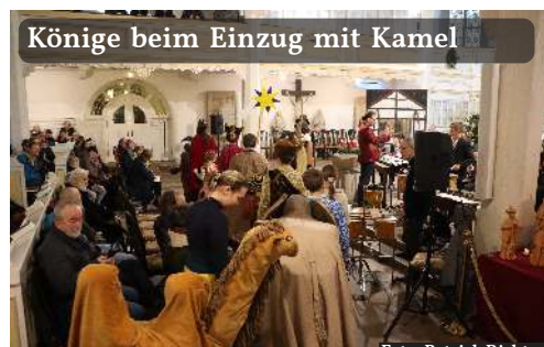
Könige beim Einzug mit Kamel

Xylophon, Flöten jeglicher Art. Dazu kommt ein Chor, der – was denn sonst! – ein Chor der Engel ist. Und schöne Gesänge von Maria und Joseph. Das alles lebt vom Zusammenspiel: Die Hirten haben reichlich Text (Danke an Karl Weber, Linus Menkö und Raphael Döge) und führen durch die Geschichte. Reich kostümiert treten die Mitspieler auf. Eindrucksvoll die Könige mit ihren Dienern, Engel, die umherschwirren und der Chor, der alles gesanglich begleitet.