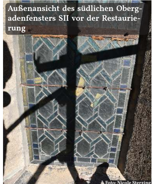
Außenansicht des südlichen Obergadenfensters SII vor der Restaurierung

Im Rahmen der Arbeiten an den Verglasungen in zwei südlichen Obergadenfenstern im Langhaus der Liebfrauenkirche konnten Fragmente mittelalterlicher Glasfenster entdeckt und geborgen werden.