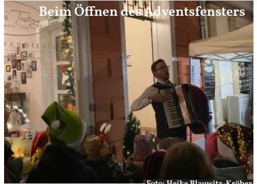
Beim Öffnen des Adventsfensters

die Hälfte der Einnahmen von diesem Abend spendete. (200,00 €)