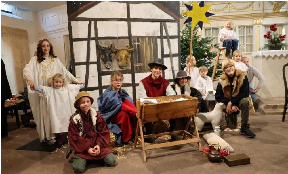
Nach der Aufführung

mosphäre noch nachspüren. Tatsächlich weihnachtlich: erleuchtend, freudig, das Herz öffnend. (MR)