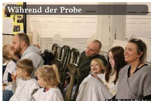
Während der Probe

beiterin sie war. In der für Orff ganz eigenen Stimmung und Musizierweise wird in einer halben Stunde die Weihnachtsgeschichte musikalisch dargestellt: Drei Hirten erleben die Weihnacht und kommentieren sie jeweils auf ihre Weise.