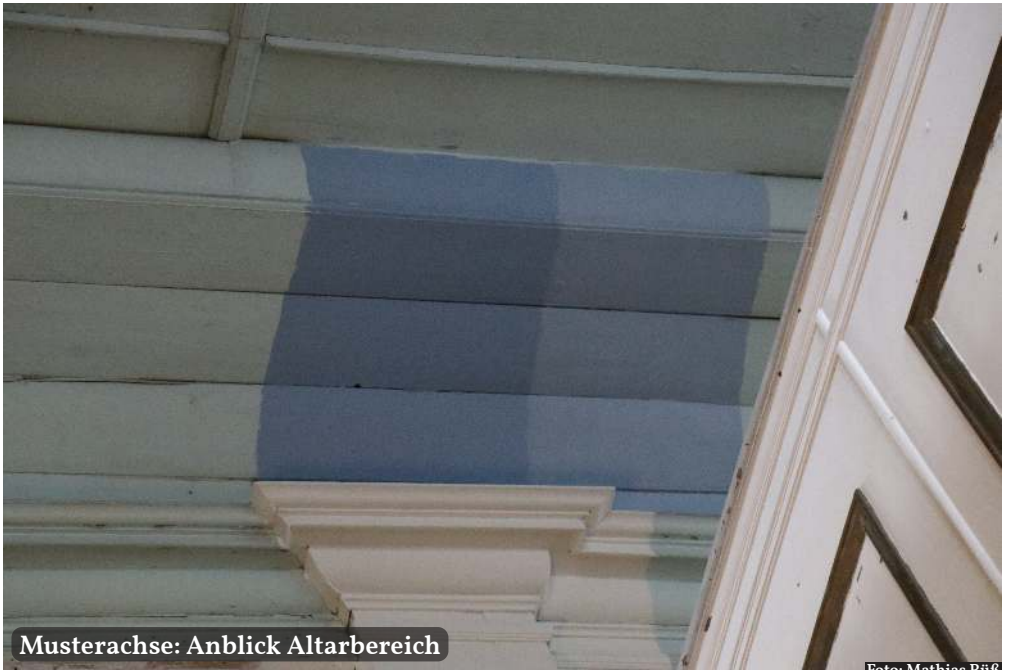
Musterachse: Anblick Altarbereich