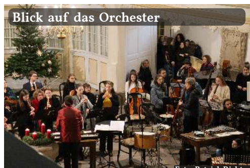
Blick auf das Orchester

Alle anderen kommen Stück um Stück dazu: die Engel, Maria und Josef und dann das große Gefolge der Könige. Dann richten die Hirten ihre Worte an die Zuhörer und befragen diese, was denn für sie Weihnachten sei. Auch wenn die Musik in vielem einfach erscheint – es ist „Jugendmusik“ –, wirkt sie doch mächtig.