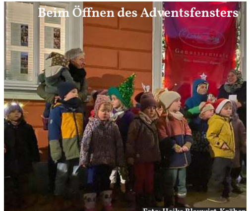
Beim Öffnen des Adventsfensters