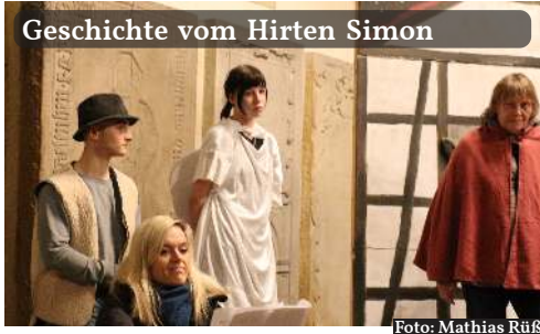
Geschichte vom Hirten Simon

ren sichtlich begeistert, als der Hirte Simon am Ende der Geschichte sein Lämmchen in einem Stall neben einer hell erleuchteten Krippe wieder fand. (MR)