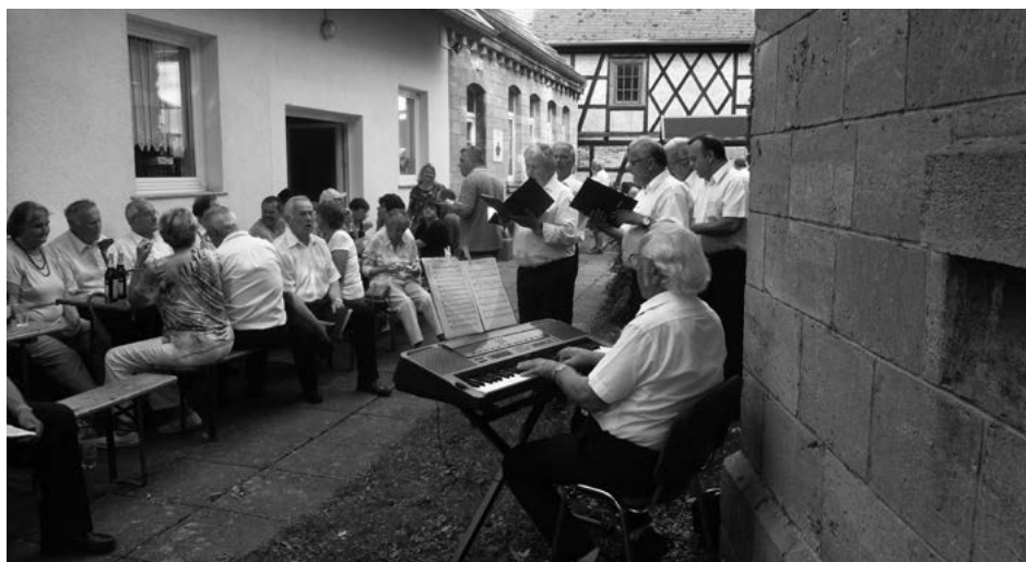
Sommerkonzert mit dem Männerchor Plaue in Espenfeld, Juli 2015