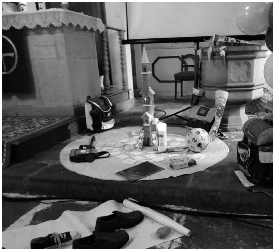
Gottesdienst zum Schulanfang, Rudisleben, 14.09.2014)

Auch in diesem Jahr soll wieder eine schöne Adventsfeier in Rudisleben stattfinden. Am Samstag, 6. Dezember, um 14.00 Uhr treffen wir uns zu Kaffee und Plätzchen im Gemeindesaal, Hauptstr. 7, hören etwas zu Advent/Weihnachten, singen miteinander und haben Zeit zur Begegnung. Jung und alt ist herzlich eingeladen. Wer Plätzchen mitbringen möchte – herzlichen Dank dafür.